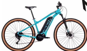
Catherine e90-29 TOURING | e90-29 e70-29 | e60-29