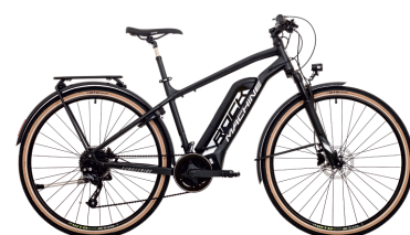
Crossride e450 TOURING