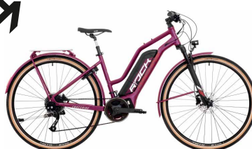
Crossride Lady e450 Lady TOURING | e450 Lady