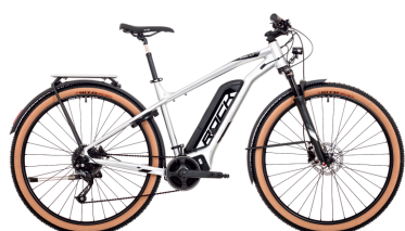
Storm e90-29 TOURING e70-29 | e60-29